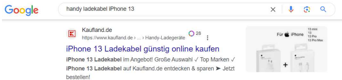
Beispiel für Google Suche mit Kaufland Ergebnis

Ausnahmsweise gilt das Credo: Viel hilft viel! Das Portfolio der Marktplätze muss zunächst genau geprüft werden, ob es zum eigenen Unternehmen oder den Produkten passt. Grundsätzlich können wir aber nur empfehlen, mehrere Marktplätze zu nutzen. Es gibt zum einen neue und treue Käuferkreise, die sich dadurch erschließen lassen. Zum anderen werden Produkte von beliebten Plattformen oftmals direkt auf den Suchergebnisseiten von Suchmaschinen, wie beispielsweise Google, ausgespielt. Dadurch erhalten Deine Produkte auf der Plattform mehr Sichtbarkeit.